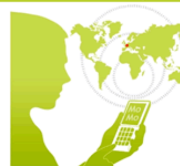
Mobile Monday - 3 octobre 2007 Répartition par secteur d'activité